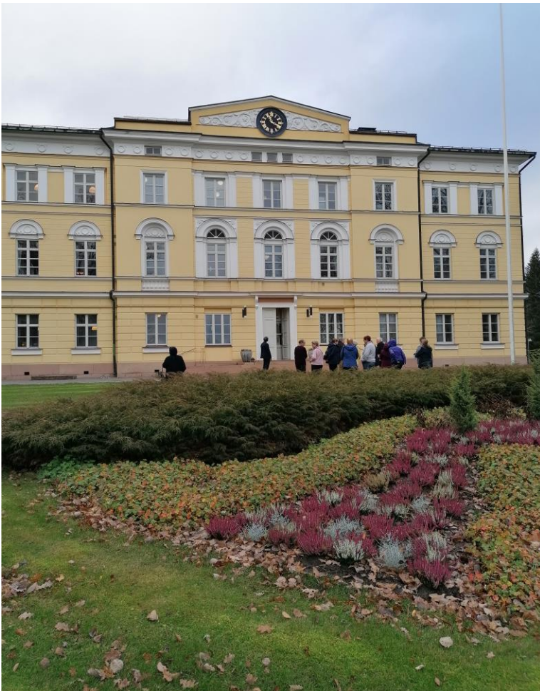
Vuojoen kartanon päärakennus Eurajoella

Opistolaisyhdistyksessä on edelleenkin aktiivisia toimijoita, jotka leipovat ja laittavat levonnaisia kahvilaan sekä ojentavat auttavan kätensä tarvittaessa. Ilman heidän apuaan emme voisi toimia millään tavoin. Suurkiitokset kaikille!