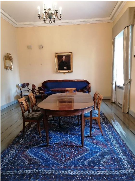
Villilän kartanon rouva tarkkailee, mitä salissa tapahtuu