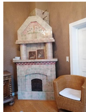
Komeat kaakeliuunit tuovat lämpöä Vuojoen ja Villilän kartanoiden saleihin

Toivomme edelleenkin opistolaisyhdistyksen toimintaan mukaan uusia, nuoria ja innostuneita opistolaisia tuomaan uusia ideoita toimintaamme. Opettajien ja kansalaisopiston yhteistyö kanssamme on edelleenkin esimerkillisen hyvää, kauaskantoista ja moitteetonta. Pyrimme jatkossakin tarjoamaan jäsenillemme virkistystoimintaa, kuten teatteri- ja musikaaliretkiä, kotimaan ja ulkomaan matkoja sekä erilaisia tapahtumia. Tavoitteena on kehittää, lujittaa ja vahvistaa opistotoimintaa ja yhteishenkeä opiskelijoiden ja kansalaisopiston kanssa.