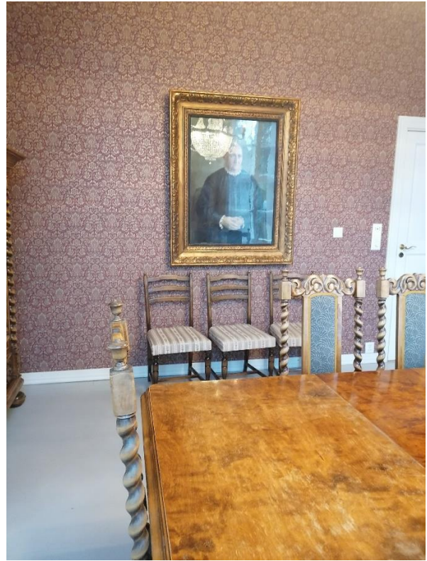
Vuojoen patruuna mahtavan puupöydän äärellä