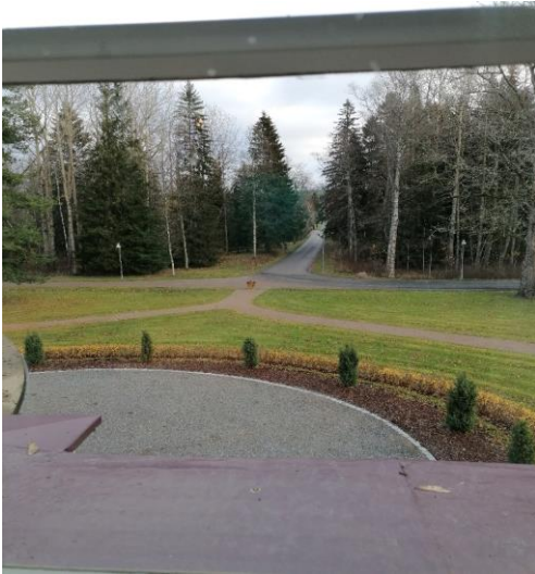
Vuojoen kartanolla risteileviä polkuja