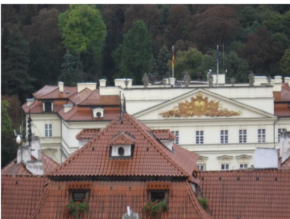
Prahan rakennukset ovat komeita, taiteellisia ja vanhoja

Myös tilojen osalta on tyytyväisyys opiskelijoiden keskuudessa lisääntynyt entisestään, sillä saatiinhan Jokioisten uudet tekstiili- ja taidetilat opetuskäyttöön viime syksynä.