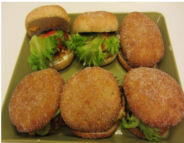
street food kala hampurilainen