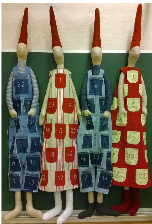
Kalenteritonttuja Humppilan kurssilta