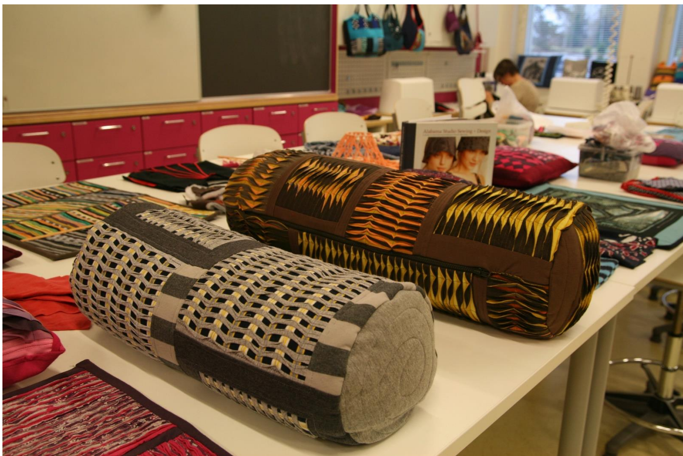
Trikoovaatteiden uusi elämä -kurssin mallitöitä (opettajana Kaija Huhtinen)