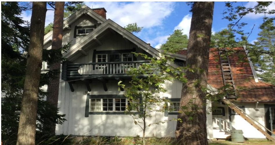
Sibeliuksen kotitalo Ainola

Yhdistys pyrkii jatkossakin tarjoamaan virkistystoimintaa, teatteri- ja kotimaan ja ulkomaanmatkoja sekä erilaisia tapahtumia, kehittämään ja vahvistamaan opistotoimintaa ja hyvää henkeä yhdessä opiskelijoiden ja kansalaisopiston kanssa.