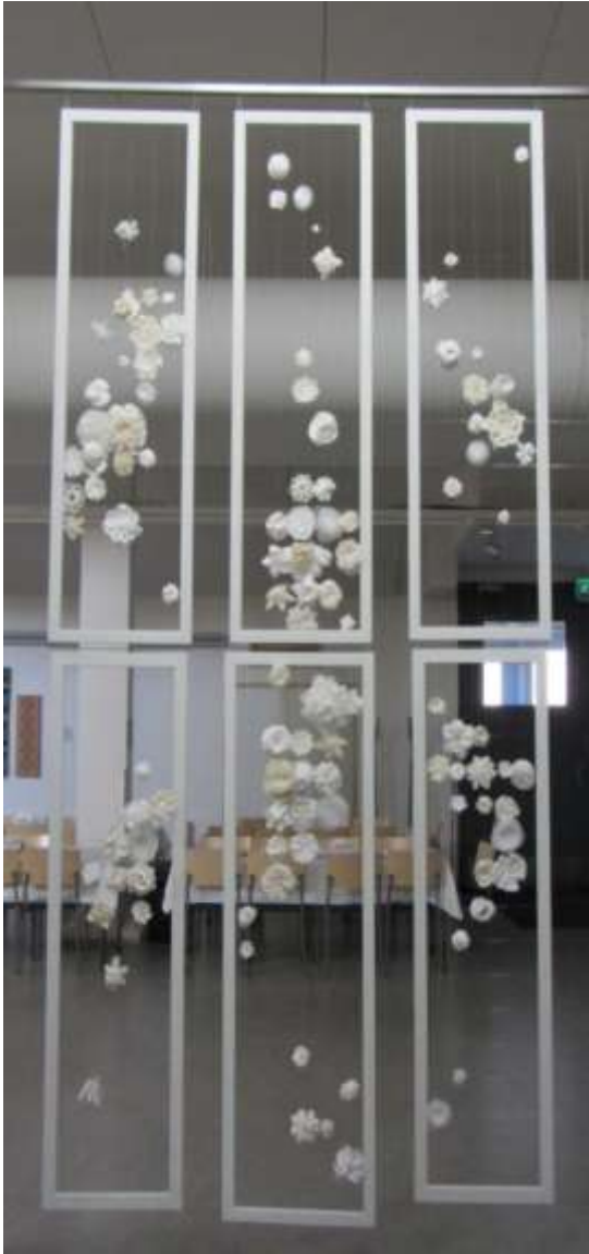
Upea yhteisteos keväänäyttelyssä!

Niistä tehtiin pöytäkoristeita, jotka ihastuttivat pöydillä juhlassamme ja yhteisteoksia lahjoitettavaksi. Ison teoksen osasia lahjoitimme joka kunnan kirjastoon näyttelyssä pidetyn kyselyn tuloksen mukaisesti. Ypäjän hoivakoti sai Ypäjän kudontakurssin kutoman tākänän, Jokioisten kirjastoon lahjoitettiin peruskurssin loimimaalattu kaitaliina ja Jokioisten terveyskeskuksen seinälle ripustettiin keramiikkakurssin kukat sekä kudonnan jatkokurssin kuultokudos. Pöytäkoristeet ovat nyt Tietotalon juhlijoiden käytössä.