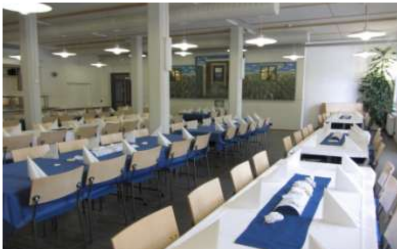
Tietotalon alakerrassa syötiin maittava juhlaillallinen.

Lukuvuoden 2012-13 teema ” Ilo juhlia yhdessä ” huipentui huhtikuussa pidettyyn opiston 40-vuotisjuhlaan. Oli hienoa huomata kuinka opiskelijat olivat mukana juhla järjestelyissä ja kuinka yhteenkuuluvaisuuden tunne kasvoi kevään aikana. Olimme suunnitelleet juhlan koristukseksi valkoiset kukkaset ja niitä kädentaitokurssit valmistivatkin aivan hurjasti eli noin 500 kappaletta!