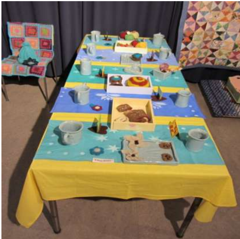
Käsityöpajalaisten kattama juhlapöytä.

Käsityöpajat muutettiin kolmivuotiseksi pajalaisten toiveesta. Kuten opettajalistasta voi lukea pajalaisille tarjotaan monenlaista tekemistä lukuvuoden aikana.