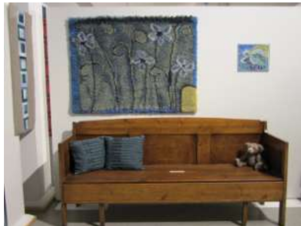
Näyttelyssä oli taas esillä monia entisöityjä huonekaluja.