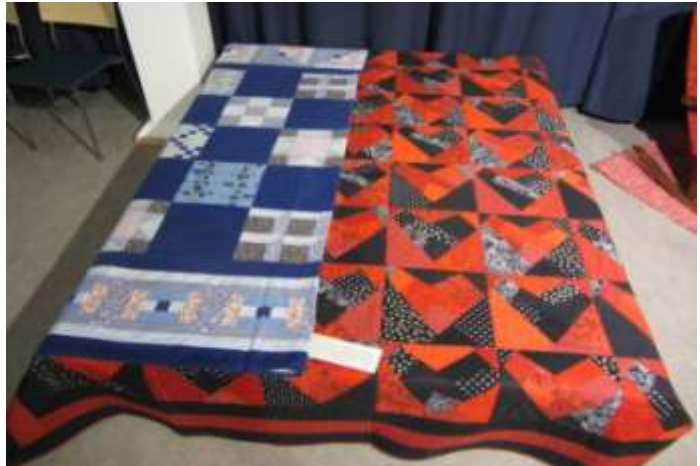
Ensimmäinen ja viimeinen tilkkutyö.

Jokioisten Tietotalolle rakennettiin juhlakevätnäyttely huhtikuun lopulla. Sinne kokosimme lukuvuoden aikana tehtyjen töiden lisäksi opiskelijoiden vanhoja töitä. Esillä oli esimerkiksi opiskelijan ensimmäinen ja viimeinen tilkkutyö. Töitä täydensi vielä hänen kertomuksensa harrastuksestaan.