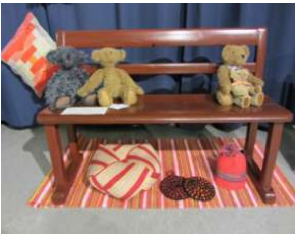
Monipuolista osaamista kädentaidon kurssilaisilta.

Esillä oli myös kaikki valkokukkaiset yhteisteokset. Koululaisille ja muillekin näyttelyssä kävijöille olimme laatineet etsintätehtävän. Sen lisäksi kysimme isolle teokselle sopivaa sijoituspaikkaa ja viihdeorkesterille nimeä. Kävijät saivat osallistua myös kukkien tekemiseen. Näyttely olikin oikein onnistunut – huikea, niin kuin yksi kävijä totesi.