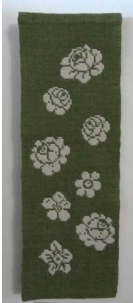
Ypäjän hoivakotiin lahjoitettu tākänä.

Syksy 2013 aloitettiin teemalla q Teeman idea tuli LAKE-hankkeen myötä. Olimmehan astumassa uuteen aikaan ja maailmaan - sosiaalisen median kautta, unohtamatta kuitenkin vanhoja hyviä käytäntöjä. Tekstiilin kurseilla teema näkyi kierrätysmateriaalien käyttönä ja vanhojen tekniikoiden soveltamisena uusiin materiaaleihin. LAKE-hankkeen myötä saimme uuden kanavan tiedottamiseen, nimittäin Facebook-sivut. Lisäksi aloitimme blogisivujen suunnittelun. Tekstiviestien avulla on tiedotettu kurssilaisille kurssien alkamisista ja muutoksista. Tästä palvelusta olemme saaneet paljon kiitosta.